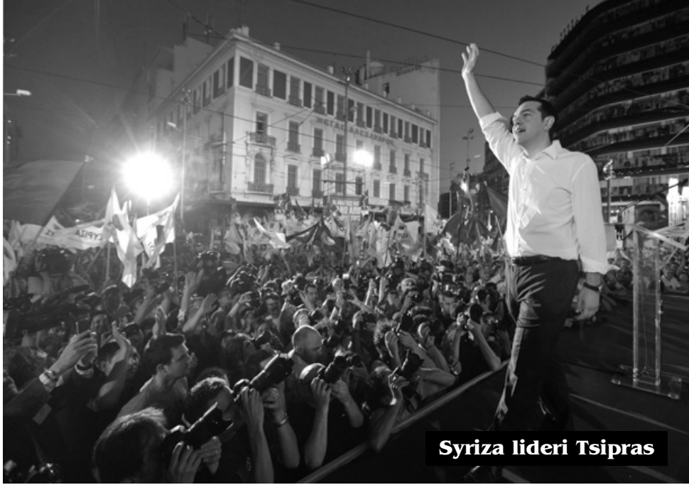
Syriza lideri Tsipras

ANTARSYA, Syriza'nın solundaki örgütlerin çatı örgütüdür. Gruplar içerisinde ARAN ve Troçkist SEK başı çeken eğilimlerdir. ANTARSYA, Syriza ve KKE gibi güçlü partilerin solunda daha radikal bir alternatif olarak kendisini göstermeye çalışmaktadır. Mayıs ayındaki AB Parlamentosu ve mahalli seçimlerde oylarını arttırmıştır. Özellikle mahalli seçimlerde elde edilen %2,2'lik oy, %3'lük seçim barajına yaklaşılması anlamında önemlidir. ANTARSYA'nın bundan önce ulaştığı en yüksek oy 2012 Nisanı'ndaki %1,2'lik düzeydir. Hatırlanacağı üzere Nisan 2012'deki seçimlerden sonra hükümet kurulamadığından Haziran 2012'de seçimler tekrarlanmış ve Yunan halkı, nisandaki sonuçların yol göstericiliğinde Syriza ve ND tercihleri üzerinden kutuplaşmıştı. Bir tarafta sosyal yıkım paketlerine karşı olan sol, diğer tarafta destek veren sağ. ANTARSYA, bu noktada önemli bir hata yaparak Syriza'ya "şartlı destek" çağrısı yapmadı. Şart da eğer